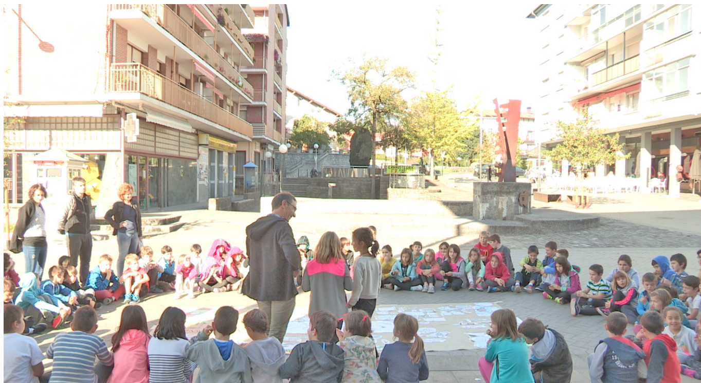
Irudia – Haurren lan-saioa, proposamenak. Egilea – Ibai Pujana Gurtubai.

identifikatu eta proposamenak egiteko aukera izan zuten herritarrek.