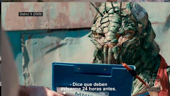
2. irudia ~ Hurrengo filmen fotogramak: "V" (1983), "The A Team" (1984), "The Goonies" (1985, Richard Donner), "District 9" (2009, Neill Blomkamp).