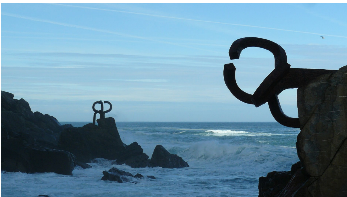
1. irudia - Eduardo Chillidaren Haizearen orrazia. Egilea - Ezezaguna.

Honenbestez, espazio publikoaren ekintza soziopolitikoaren gunea bada, komunitatea egituratzen duen botere-harremanen isla ere izango da. Horregatik, herritarrek partekatzen duten espazio batean eskultura bat kokatzean, erabakiak hartzeko ahalmena edo agintea nork duen ere irudikatuko dute. Hala izanik, gune publikoak emakumeek jasan duten bazterketa historikoaren adierazle ere bada. Eskulturen gaiarekin lotuz, ikustekoa bezain argigarria izango da emakume eskultoreek, esku-hartze paperean, hiri-espazioetan izan duten parte-hartze minimo eta berantiarra aztertzea. Hain zuzen, Espainia mailan laurogeiko hamarkada arte ez ziren eman lehenengo kasuak, eta Euskal Herrian, ia-ia XX. mendeko lehen hamarkadan, horietan adibide esanguratsuenak Elena