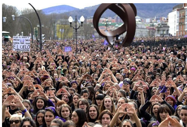
2.irudia – Iraganeko harri jasotzaileen argazkia.